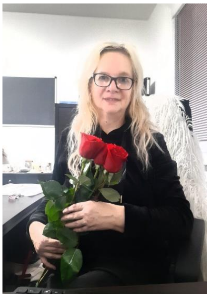
Manažérka kvality RDS

Vážení a milí obyvatelia Ružinovského domova seniorov, rada by som Vás oboznámila so systémom manažérstva kvality v našom zariadení. Ružinovský domov seniorov zabezpečenia systém plnenia podmienok kvality v zmysle prílohy č. 2 Zákona o sociálnych službách. Riadi sa metodickými príručkami systému manažérstva kvality a to: