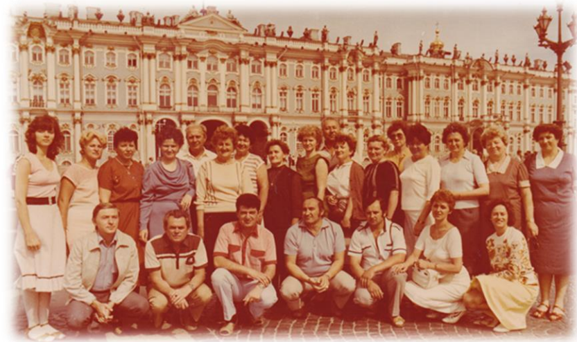
Pred Zimným palácom Petrohrad

vode. Odlet lietadla sa blížil a my sme boli od letiska v Adleri ďaleko. Zmobilizovala som všetky zložky aké v Inturiste i v hoteli jestvovali. Volali sme na letisko aby zdržali odlet, armáda nám poslala terénne auto, to išlo pred naším autobusom, ktorý sa cez vodnú spúšť doslova plavil. Odlietali sme o dve hodiny neskôr, ale všetci neutopení a nezranení. Od tej únavy som v lietadle zaspala a zobudila sa až keď letuška hlásila pristávanie.