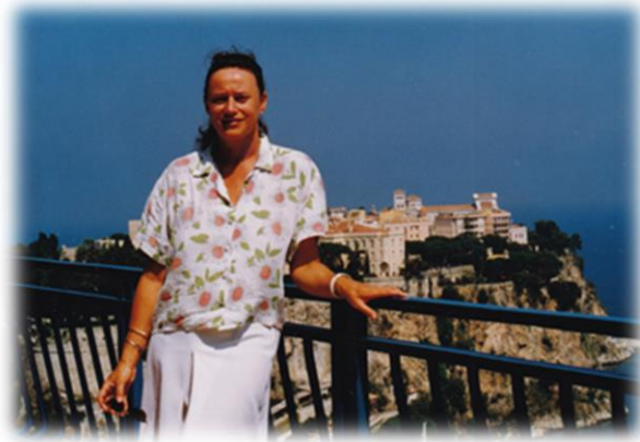
Monte Carlo Monacké kniežatstvo

Veriť sa nám nechce, že sme pred tridsiatimi piatimi rokmi nemohli vybehnúť do susedného Rakúska, na ktoré sa pozeráme z nášho Sandbergu alebo iných kopcov v Devínskej Novej Vsi. Sadneme do autobusu alebo auta a ideme na nákupy do Hainburgu alebo Kittsse len tak s občianskym preukazom, bez zbytočných doložiek a valutových prídeltov, ako za čias socializmu. Tuším pätnásť rokov som brázdila cesty po blízkej Európe s turistami na poznávacích zájazdoch, ale aj letných dovolenkách. Nesmierne ma to bavilo a neskromne si namýšľam, že som bola dobrá